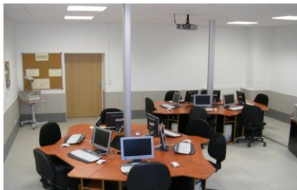
Salle conception numérique (Pôle Sup)