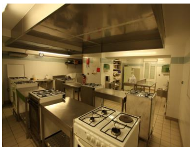
Cuisine Pédagogique (BAC PRO SAPAT)

Exemples d'équipements financés avec l'aide des versements de la Taxe d'apprentissage: