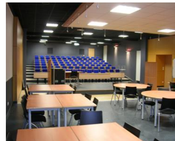
Salle de Conférence (Pôle Sup)