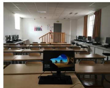
Salle informatique (BAC STMG)