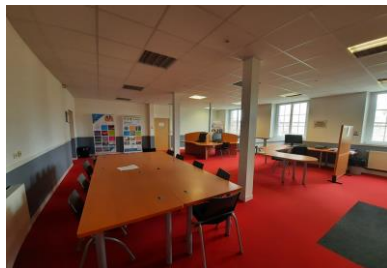
Espace professionnel (Pôle Sup)