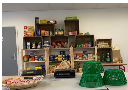
Salle des ventes (BAC PRO TCVA)